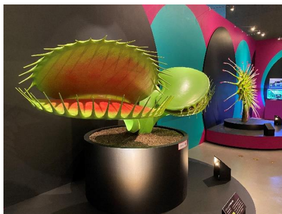
▲ハエトリソウ（左）と モウセンゴケの拡大模型