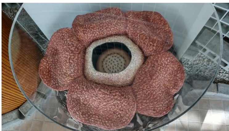
▲ラフレシア（模型） 京都府立植物園蔵 ※模型を展示