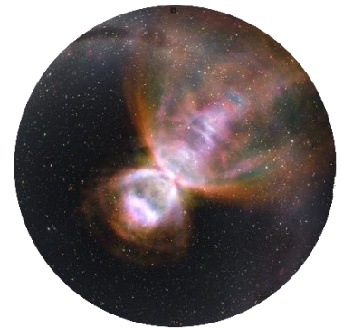
惑星状星雲バタフライ星雲