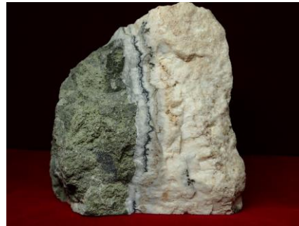
6. 金銀鉱（鹿児島県伊佐郡菱刈町 菱刈鉱山）