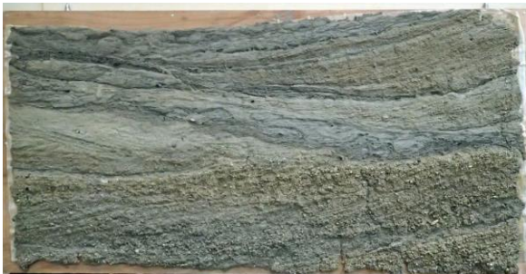
7. 瓜破遺跡 地層はぎ取り標本