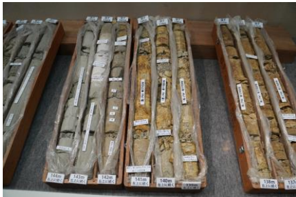
1. 大阪市内で採取された活断層調査のボーリングコア（第51回特別展の展示の様子）