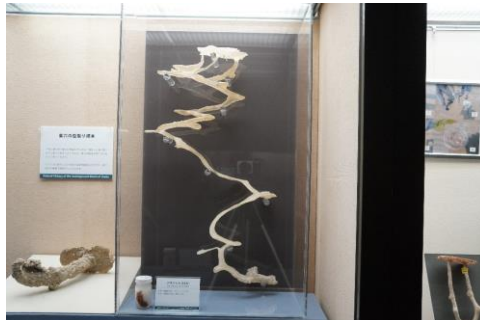
8. ハサミシャコエビの巣穴の型取り標本