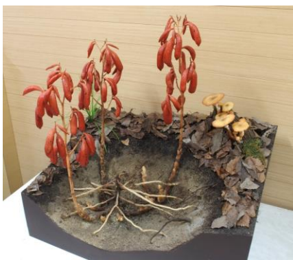
9. ツチアケビの模型