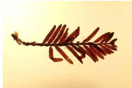
3. メタセコイアの枝先標本