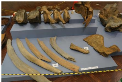
2. 大阪平野地下から見つかった様々なクジラの骨の化石（第51回特別展の展示の様子）