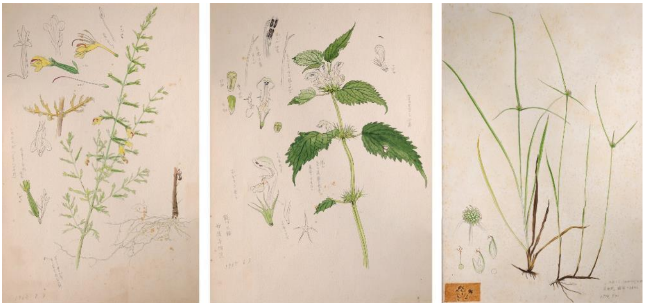
天木茂晴の挿絵：植物の細密画

ため池の岸からの水深の変化に応じて生育する水草が変わっていく様子がきれいに描かれており、水草の生活が一目でよくわかる一枚。