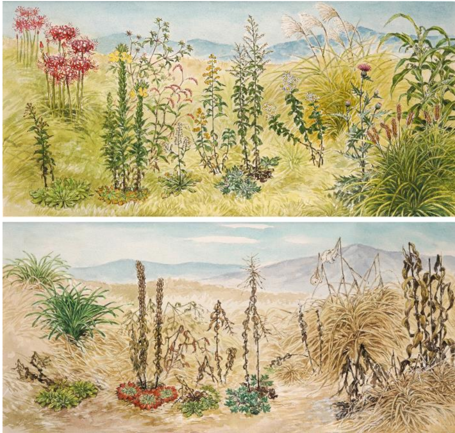
天木茂晴の挿絵：秋の草はら（上）と冬の草はら（下）

草はらに生きる植物について、同じ場所で季節を変えて、個々の植物を強調して描いている。冬であってもロゼット葉でしっかりと生きている様子がわかりやすく描かれている。