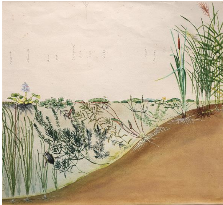
天木茂晴の挿絵：水草（東京大学総合研究博物館所蔵、同館写真提供）

ため池の岸からの水深の変化に応じて生育する水草が変わっていく様子がきれいに描かれており、水草の生活が一目でよくわかる一枚。