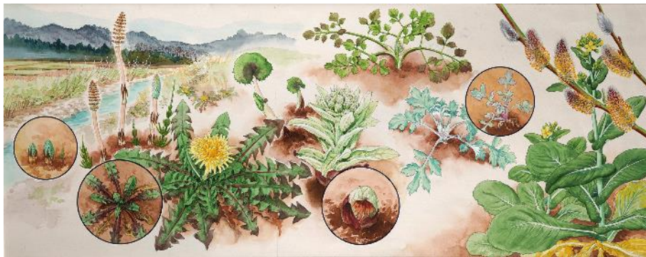
天木茂晴の挿絵：早春の野辺の植物

草はらに生きる植物について、同じ場所で季節を変えて、個々の植物を強調して描いている。冬であってもロゼット葉でしっかりと生きている様子がわかりやすく描かれている。