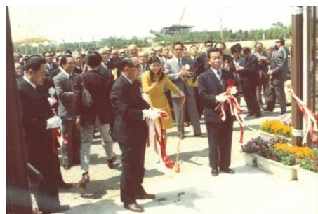
1974(昭和49)年4月27日 オープニングセレモニーの様子