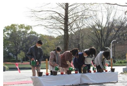
2022 年 4 月 1 日 記念種まきの様子

その後、すくすくと成長し、発芽したクヌギの苗木を、本セレモニーにて記念植樹します。