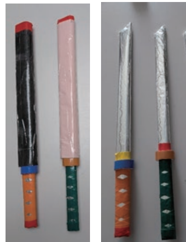
完成例(鞘から出し入れできます)