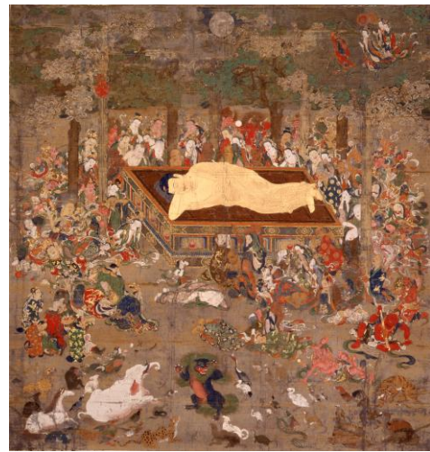
重要文化財 ぶつ ねはんず 仏涅槃図 鎌倉～南北朝時代・14世紀 長寶寺蔵 【前期展示】

大阪市立美術館には、所蔵品の他に社寺、個人の方々からの寄託品が数多く保管されています。本章からは、寄託品も含めた名宝の数々が登場します。 美術は、物語と共に物事を記録し、人々に伝える手段として発達しました。本章では、仏画から世俗画、さらには工芸品までの幅広い「物語の美術」を『全力』でご紹介します。近年国宝に指定された通称「目無経」は、内容、背景、伝来のいずれにも物語が込められる総合的「物語の美術」です。