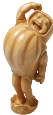
達磨牙彫根付 銘「宗明」 明治時代・19世紀 大阪市立美術館蔵 カザールコレクション