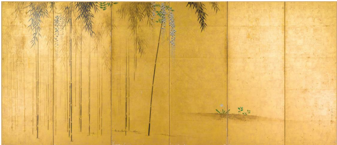
たけふじず 竹藤図（右隻） 長谷川等二筆 江戸時代・17世紀 大阪市立美術館蔵 田万コレクション【後期展示】

2023年度に修復が行われた銅鏡。鏡全体が、大きく3つに割れており、過去にも修復がなされたが、改めて強化・補強、過去の修理痕の除去等を行った。伍子胥は、紀元前6～5世紀の人物。父と兄の敵討ちの説話が古来知られる。