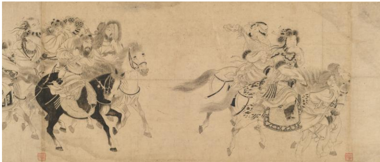
重要文化財 めいひしゅつさいず 明妃出塞図 (部分) きゅうそねん 宮素然筆 中国・金時代・12世紀初 大阪市立美術館蔵 阿部コレクション 【後期展示】

妖怪、鬼神、付喪神などが暗闇を闊歩する様子を描く。実際に妖怪たちが何をしているかストーリーは不明ながら、ユーモラスで生き生きとした描写は鑑賞者を惹きつける。伝土佐光信筆の真珠庵本を原在中が写した作品。