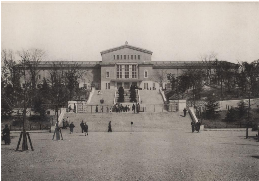
開館当初の大阪市立美術館 昭和11年（1936）