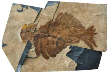
▲アノマロカリス(レプリカ) カンブリア紀/ラディオドンタ類/ 国立科学博物館