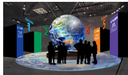
▲「大絶滅スフィア」のイメージパース ※画像はイメージです。