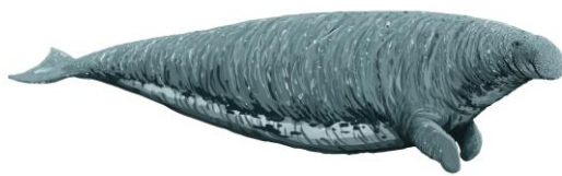
▲ステラーダイカイギュウ 更新世～1768年/ジュゴン科/ 国立科学博物館